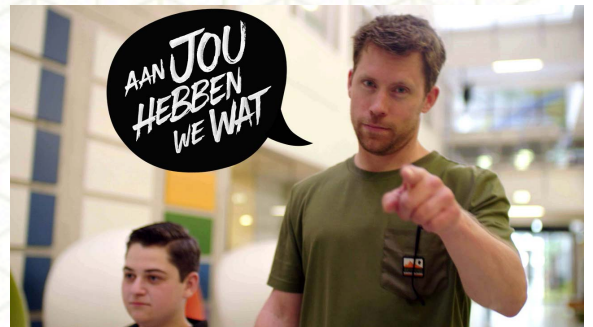
1 LESMATERIAAL WWW.AANJOUHEBBENWEWAT.NL

Alle deelnemende leerlingen hebben in jaar 3 al gekozen voor het profiel Zorg en Welzijn. Ze zijn daardoor al wat bekend met de zorgsector. In dit project gaan ze verder de diepte in.