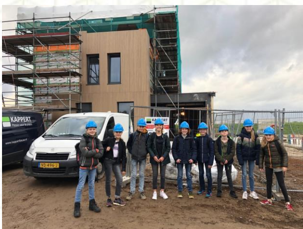
AFBEELDING 1 LEERLINGEN ELIGANT OP BEZOEK BIJ KAPPERT BOUW

Op 24 november 2020 gingen we tijdens een online kennissessie met partners van Blikopenerprojecten in op de vraag hoe je op een goede manier met elkaar kunt samenwerken. Een mooi gesprek, over de energie die uit de samenwerkingen naar voren komt én de belangrijke vraag hoe je een project kunt borgen. Zodat partners samen kunnen doorgroeien en projecten nog meer impact kunnen krijgen!