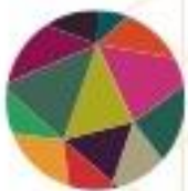
AFBEELDING 3 PROJECTONTWERP 'KLIMAAT IN DE KLAS'

Bijzonder aan hun Blikopener is dat er vanuit uitdagende opdrachten voor leerlingen over luchtkwaliteit is opgebouwd met drie verschillende bedrijven: Studio Nico Wissing (tuin- en landschapsonwerp), Bronkhorst High-Tech (meet- en regelapparatuur voor gassen en vloeistoffen) en Studio Magnolia (interieurontwerp en styling). In de afbeelding hieronder een korte schets van het project. Voor meer informatie over de invulling van het project, lees de drie blogs van het Educatiepunt over het project of het artikel dat in het huis-aan-huisblad Contact is verschenen.