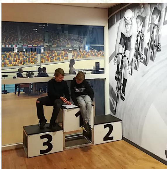
AFBEELDING 1 LEERLINGEN VAN RKBS DE SCHAKEL WERKEN IDEEËN UIT VOOR DE INRICHTING VAN HET SPORTCAFÉ VAN TOPSPORTCENTRUM OMNISPORT

Op 19 november 2020 gingen we tijdens een online kennissessie met partners van Blikopenerprojecten in op de vraag hoe je leerlingen via reflectie kunt helpen om zoveel mogelijk uit een project te halen. Een interessante uitwisseling, die vooral over verbindingen bleek te gaan!