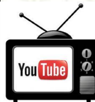
AFBEELDING 3 VIDEO OVER REFLECTIEAANBOD DE WERELD VAN LOB EN I(TALENT)

Hun aanbod is een voorbeeld van hoe reflectie de impact binnen een project kan optimaliseren. Het Educatiepunt streeft niet naar één werkwijze voor al haar projecten, maar naar een verzameling tools waarmee projecten optimaal kunnen worden ontworpen, passend bij de school en haar samenwerkingspartner en de omstandigheden op het moment. Daar praten we tijdens de kennissessie over door.